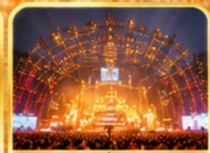
สถานที่จัดงาน เทศกาลเบียร์ชิงเต่า