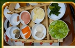
ขนมจีนข้ามสะพาน