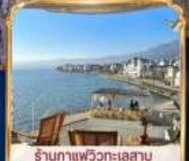
ร้านกาแฟวิวทะเลสาบ BAN SHAN YUE (รวมค่าเช่า ไม่รวมเครื่องดื่ม และค่าเช่าเตียงกำขม)