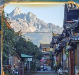
เมืองโบราณซูเหอ