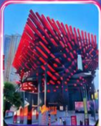
ศูนย์ศิลปะกะวู่โต๋