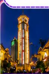
ตึกไควอิ่งไหลว