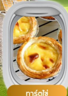
การ์ตไข่