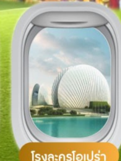
โรงละครโอเปร่า