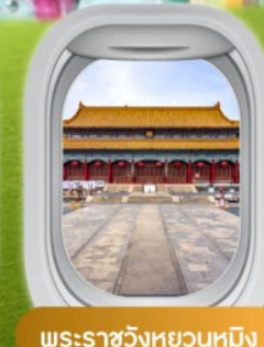
พระราชวังหยวนหมิง