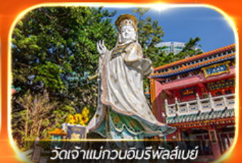
วัดเจ้าแม่กวนอิมทิฟลีย์เบย์

รวมตั๋วดิสนีย์แลนด์+รถรับ-ส่ง ซอปปิงแบบจัดเต็ม พักย่านจิมซาจุ่ย