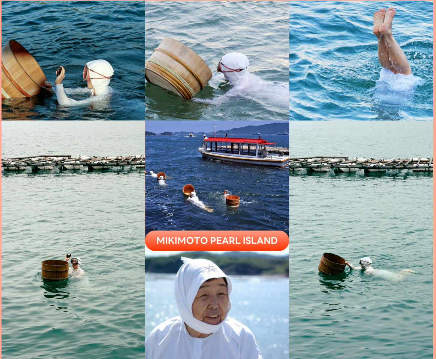
MIKIMOTO PEARL ISLAND

จากนั้นนำท่านเดินทางไปยัง เมืองอิเสะ (Ise) เป็นศูนย์กลางทางจิตวิญญาณที่ศักดิ์สิทธิ์ที่สุดของญี่ปุ่น บรรยากาศเมืองเต็มไปด้วยกลิ่นอายประวัติศาสตร์ โดยเฉพาะย่านเมืองเก่า และร้านค้าดั้งเดิม เพื่อนำท่าน ชมโชว์ดำน้ำอามะซัง ที่เกาะไข่มุก Mikimoto Pearl Island โดยผู้หญิงที่ดำน้ำลงไปทะเลโดยไม่ใช้อุปกรณ์ดำน้ำใดๆ คือ อามะซัง (Ama san) ทุกท่านจะได้ทั้งความรู้ ความสนุก รับรู้ถึงจิตวิญญาณของท้องทะเล ใช้เวลาเดินทางประมาณ 1 ชั่วโมง