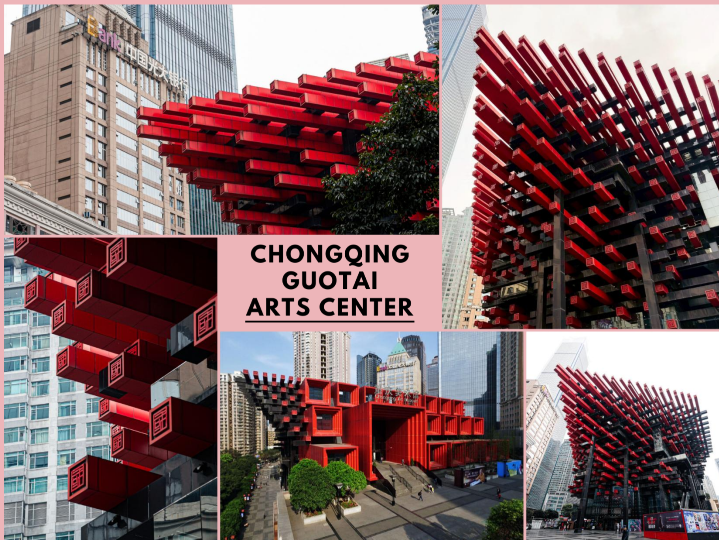
CHONGQING GUOTAI ARTS CENTER

จากนั้นนำท่านสู่ ตึกตะเกียบ (Chongqing Guotai Arts Center) แลนด์มาร์กดีไซน์ล้ำสมัย เป็นสิ่งก่อสร้างอันมีเอกลักษณ์ อาคารนี้ถูกออกแบบให้มีรูปร่างคล้ายกอง “ตะเกียบยักษ์” สีดำ และแดงที่วางซ้อนกันเป็นชั้น ๆ สร้างความประทับใจให้กับผู้พบเห็นตั้งแต่แรกเห็น นอกจากนี้จะเป็นสัญลักษณ์ที่โดดเด่นแล้ว ยังเป็นศูนย์รวมงานศิลปะที่สำคัญ มีการจัดแสดงนิทรรศการศิลปะหลากหลายประเภท ทั้งภาพวาด ประติมากรรม และการแสดงต่าง ๆ สะท้อนถึงความคิดสร้างสรรค์ และการผสมผสานระหว่างวัฒนธรรมจีนดั้งเดิมกับความทันสมัยได้อย่างลงตัว ตึกตะเกียบจึงเป็นสัญลักษณ์แห่งความภาคภูมิใจ ความเป็นเอกลักษณ์ของเมืองฉงชิ่งที่นำมาเยือน และชื่นชมอย่างยิ่ง