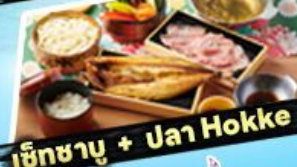
เซ็ทซาบู + ปลา Hokke