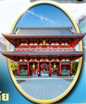
วัด เซ็นโซจิ