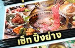
เซ็ท บิงย่าง