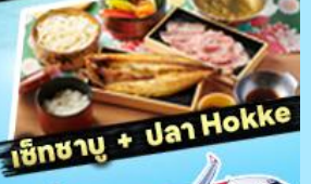
เอ๊กซาบู + ปลา Hokke

36,919 ราคา เริ่มต้น บาท รวมภาษีมูลค่าเพิ่ม 7%