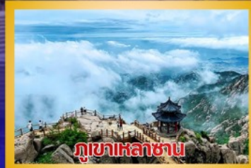
ภูเขาเหลาชาน