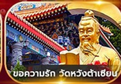
ขอความรัก วัดหวังต้าเซียน