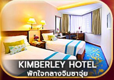
KIMBERLEY HOTEL พักใจกลางจิมซาจ่ย