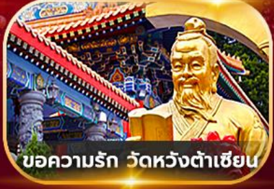
บ่อความรัก วัดหวังต้าเซียน