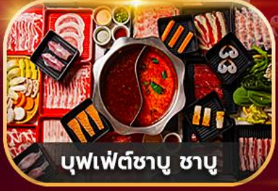
บุฟเฟ่ต์ซาบู ซาบู