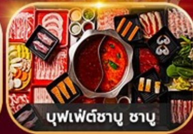
บุฟเฟ่ต์ซาบู ซาบู