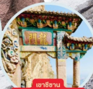
เขาสีซาน รวมกระเช้า+รถแบคเตอร์