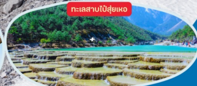
ทะเลสาบไป๋ส่วยเหอ