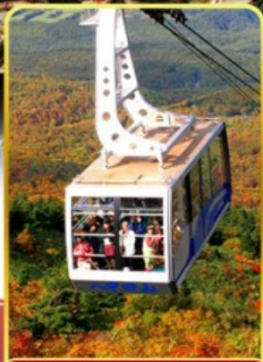
นั่งกระเช้าอากิโกะ