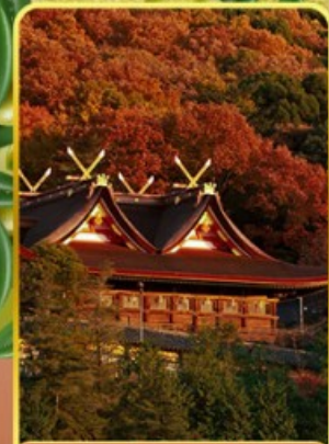
ศาลเจ้าคิบิฮิโกะ