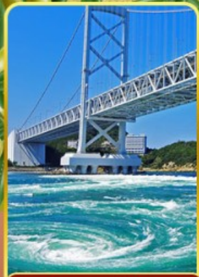
ช่องแคบนารุโตะ