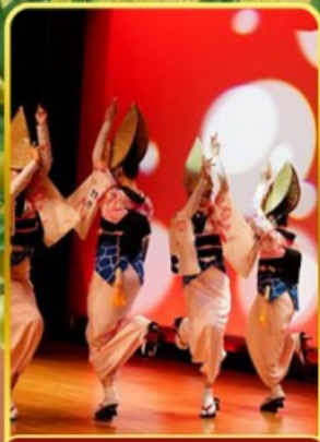
อะวะ โอะโตะริ โคคัง