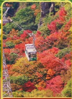
กระเช้าหุบเขาคังคาเคอิ