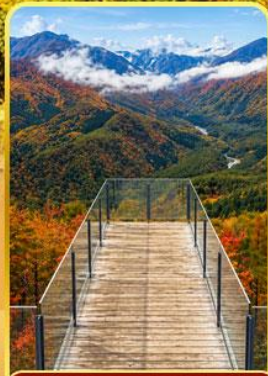
อาคุบะอิวาดากะ