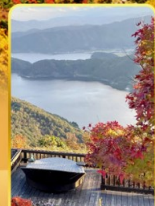
จุดชมวิวกะเลสาบมิกาคะ