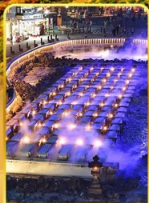
ชมยูมาทากะ