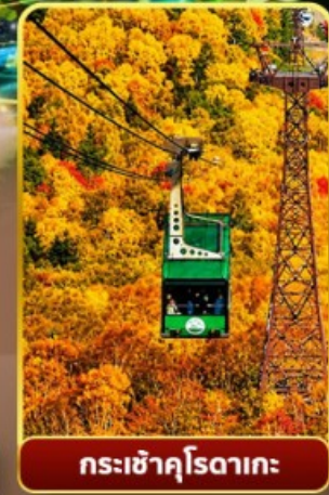
กระเช้าคุโรดากะ