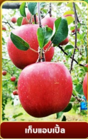
เก็บแอปเปิ้ล