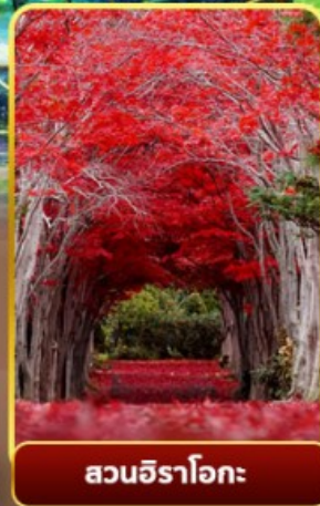
สวนอิราโอกะ