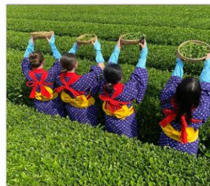
กิจกรรมเก็บชามียาโนเอ็น