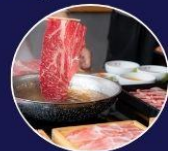
ปิ้งย่างพรีเมียม ROKKASEN เนื้อคุณภาพ