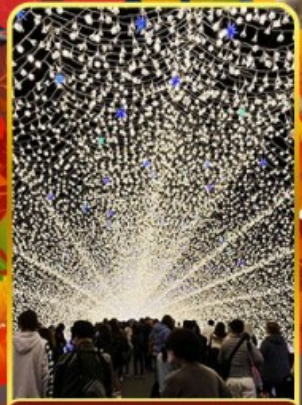
นาบะนะโนะซาโตะ