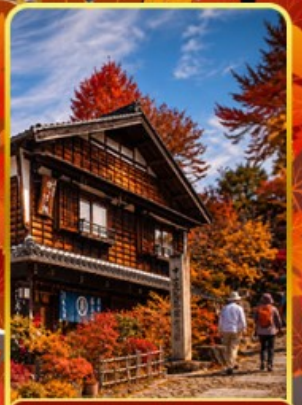
หมู่บ้านมาโกเมะจุกุ