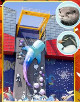
พิพิธภัณฑ์ไคยุคัง

ออนเซ็น 2 คั้น นน.กระเป๋า 23 กก.X2 8Days 5Night