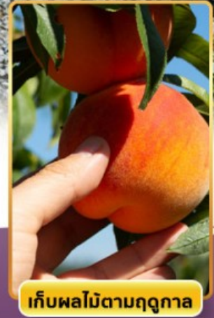
เก็บผลไม้ตามฤดูกาล

ออนเซ็น 3 คืน นน.กระเป๋า 23 กก. 8Days 5Night