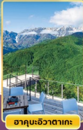
ฮาคุบะฮิวาตากะ