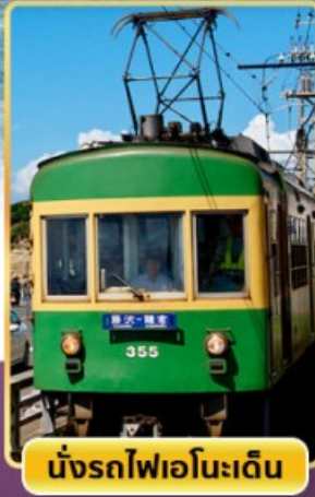
นั่งรถไฟเอโนะเด็ง