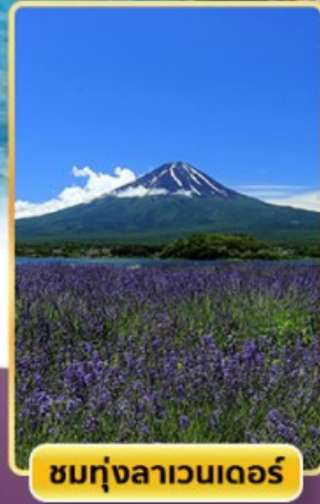
ชมทุ่งลาเวนเดอร์