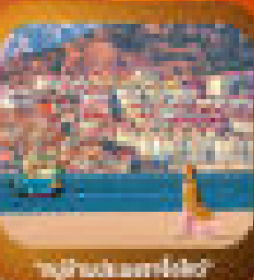
ทิวทัศน์เมืองเก่า