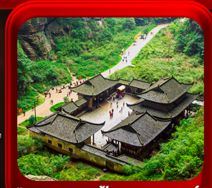
“ อุทยานหลุมฟ้าสะพานสวรรค์ ”