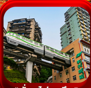
“ นิ่งรถไฟคะลุกติก ”

บินตรงลงธงชิง • อุ๋หลง หลุมฟ้าสะพานสวรรค์ • ระเบียงแก๊ว • อุทยานเขานางฟ้า หงหยาดัง • นิ่งรถไฟคะลุกติก • ศาลาประชาม (ด้านนอก) • หลงหมินฮ่าว มรดกโลกผาหินแกะสลักต้าจู้ • วัดหลิวฮั่น • ตึกตะเกียบ • หมู่บ้านโบราณสี่ซีโหว่