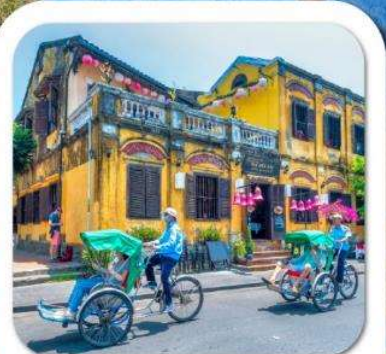
"เมืองโบราณฮอยอัน"