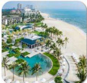
"พัก 5 ดาว HYATT DANANG 2 คืน"