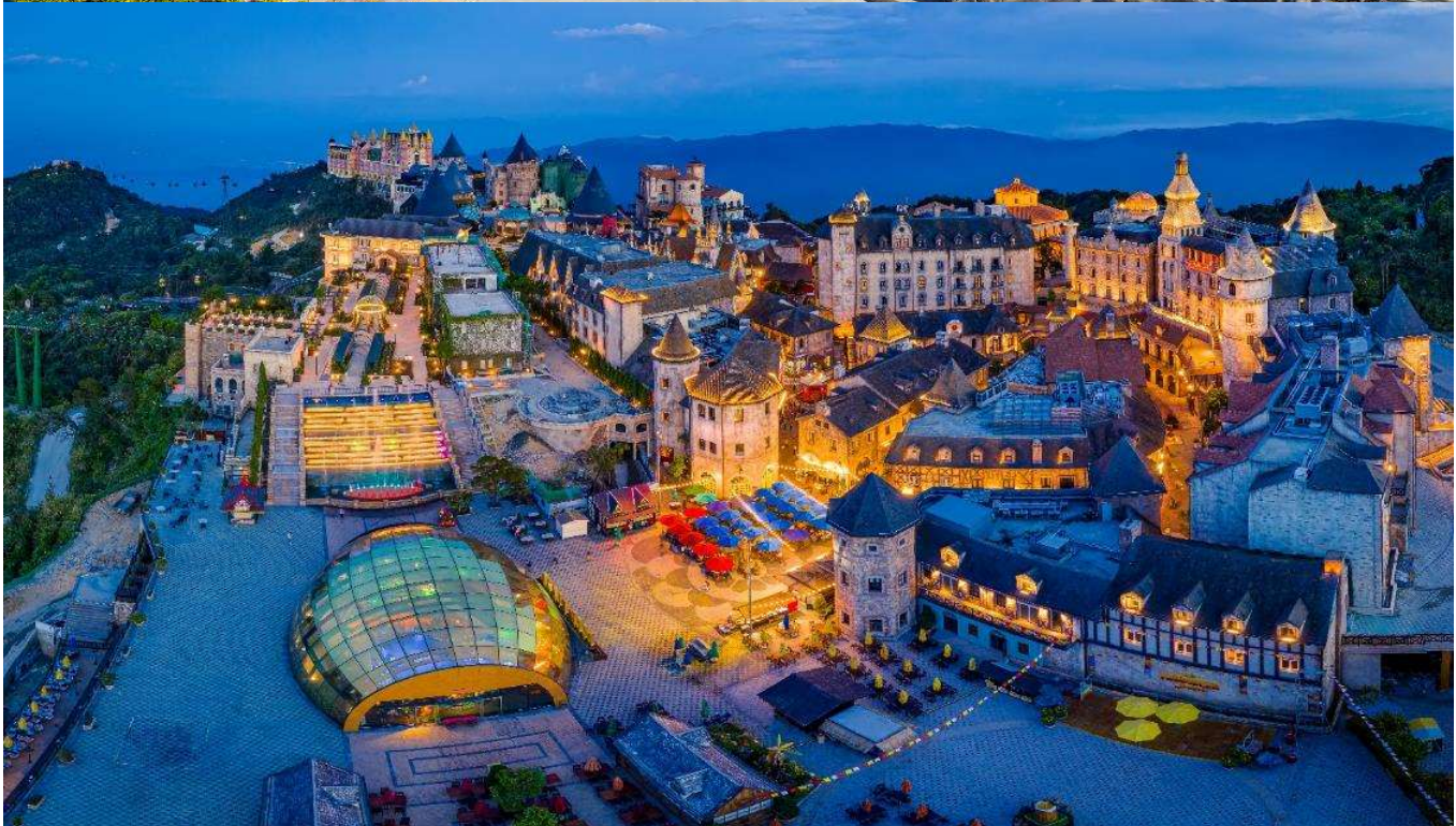
T2G-DAD01VZ Exclusive Danang BanaHill... ดานัง ฮอยอัน บาน่าฮิลล์ 4 วัน 3 คืน (VZ) ไม่ลงร้าน