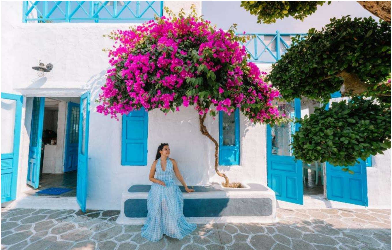
เที่ยง รับประทานอาหารเที่ยง ณ ร้านอาหาร

จากนั้นนำท่าน คาเฟ่ Son Tra Marina Cafe จุดเช็คอินสุดชิลในเวียดนาม คาเฟ่ริมทะเล สไตล์ซานโตรินี่ ในเมืองดานัง อยู่ใกล้วัดหลินอิ่ง (วัดเจ้าแม่กวนอิม) ร้านน่ารักตกแต่งมีสไตล์ดีริมทะเล แต่งร้านโทนขาว ฟ้ามองสบายตา ใครกำลังอยากมีแพลนเที่ยวเวียดนาม ห้ามพลาดคาเฟ่ Son Tra Marina Cafe นี้เลย