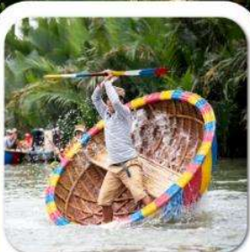
"ล่องเรือกระดิง"

นั่งกระเช้าที่ยาวที่สุดในโลก ขึ้นสู่บาน่าฮิลล์ • หมู่บ้านฝรั่งเศส • สวนสนุก FANTASY PARK LE JARDIN D'AMOUR • สะพานมือสีทอง • วัดหลินจิ้ง • เมืองโบราณฮอยอัน หมู่บ้านกิมถาน • ล่องเรือกระดิง • สะพานมังกร • APEC PARK • ตลาดฮาน