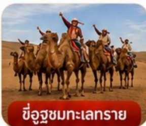
ขี้อูฐทะเลทราย