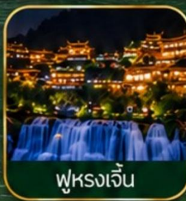
ฟูหรงเจิ้น