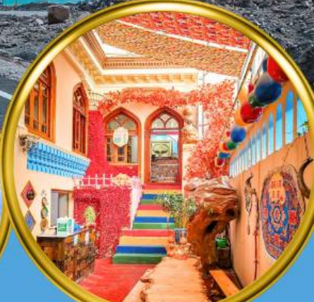
เมืองเก๋าคิชการ์