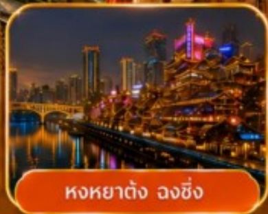
หงหยาดัง ฉงชิ่ง