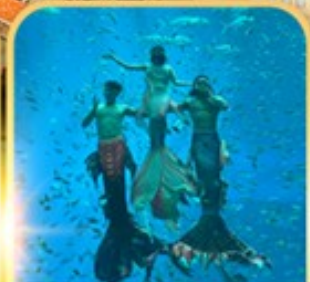
อควาเรียม