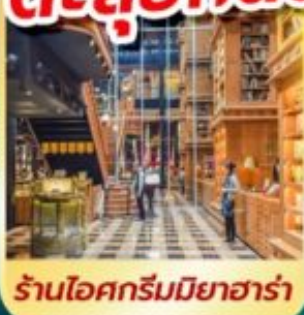
ร้านไอศกรีมมียาฮาร์