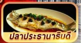
ปลาประรานาภิรมดี