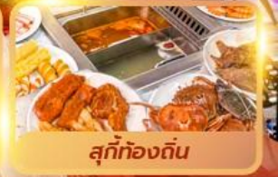
สุกทุกอย่าง