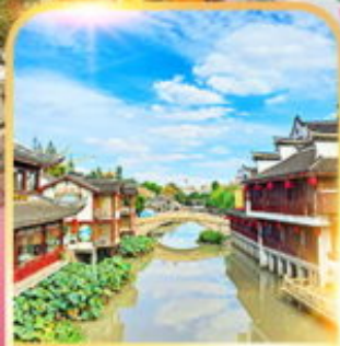
เมืองโบราณซีเป่า