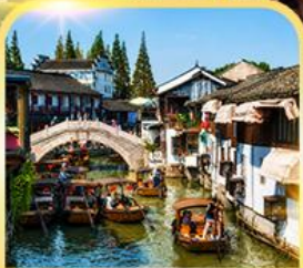
เมืองโบราณซูเจียเจี๋ย