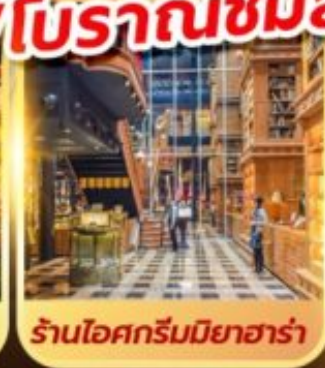
ร้านไอศกรีมมียาฮาร่า