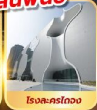
โรงละครโดง