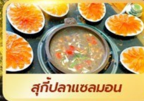
สุกี้ปลาแซลมอน