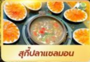
สุกัปลาเซลมอน