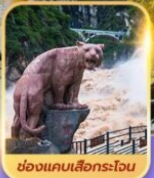
ช่องแคบเล็องกระโจน