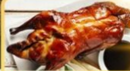
เป็ด Four Season