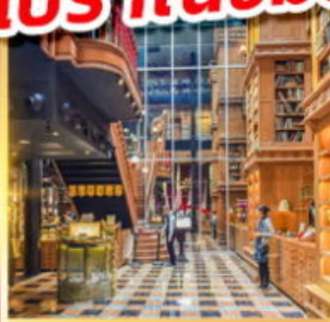
ร้านไอศกรีมมियाฮาร่า