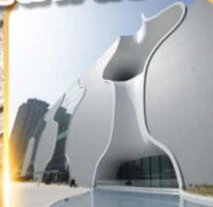
โรงละครไถจง