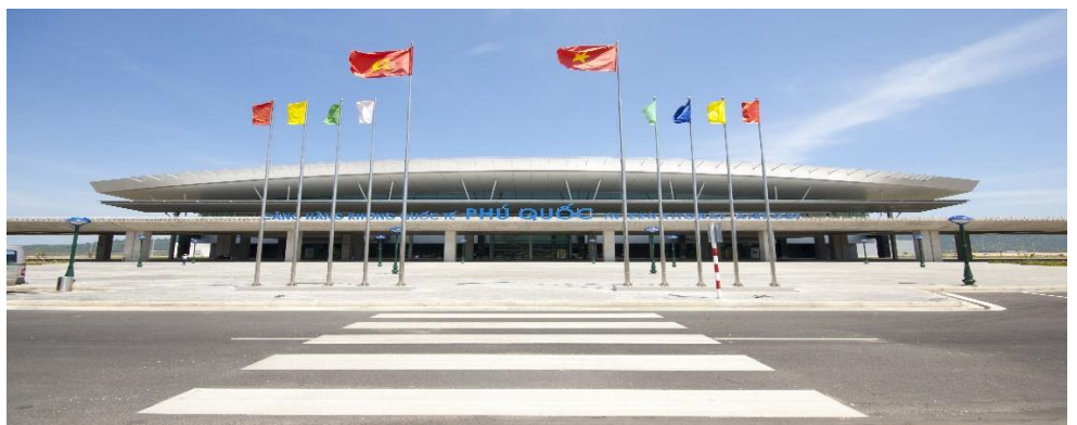
PHU QUOC (สนามบินพูก๊วก)