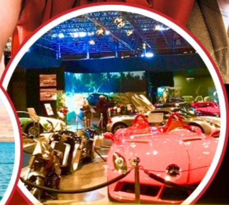
Royal Automobile Museum