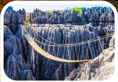
อุทยานแห่งชาติซิงกี เดอ เบอมาราฮา