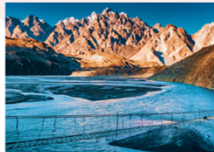
สะพานแขวนฮุสไซนี

** พักที่ Sarai Silk Route Hotel หรือเทียบเท่า **