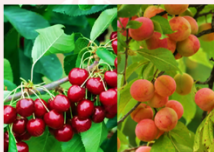
สวนผลไม้ตามฤดูกาล

** พักที่ Duiker Hard Rock Hotel หรือเทียบเท่า **