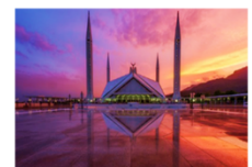
มัสยิดไฟซาล

19.30 น. นำท่านเดินทางสู่สนามบินอิสลามาบัด 23.20 น. ออกเดินทางสู่กรุงเทพ เที่ยวบิน TG350