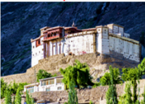
บ่อมบัลดิท