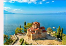
St. John at Kaneo Church