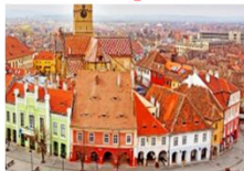
เมืองซีบีอู