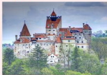
ปราสาทแดร์ริคูล่า

** พักที่ Ramada by Wyndham Sibiu Hotel 4* หรือเทียบเท่า **