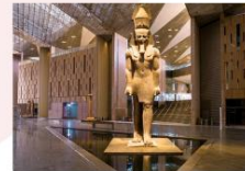
Grand Egyptian Museum