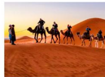
ซ็อูรทองทะเลทรายซาฮารา ที่ทะเลทรายซาฮารา

DAY8 ซ็อูรทองทะเลทรายซาฮารา-วอซาเซท-ป้อมปราการ Kasbah Ait Ben Haddou (โมร็อกโก)