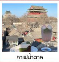
คาเฟ่ น้ำตาล