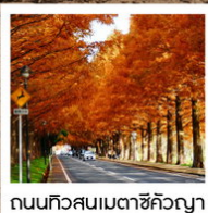
ถนนทิวสนเมตาชิคิวญา