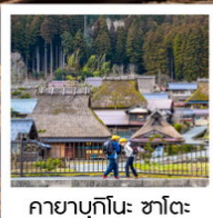
คยาบุกิโนะ: ซาโตะ