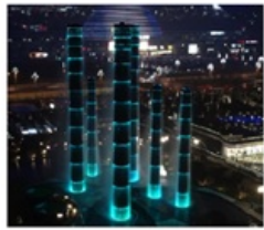
ห้างสรรพสินค้า SKP