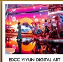
EDCC YIYUN DIGITAL ART