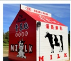
ฟาร์มโคนมจินเหมิน