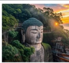
หลวงพ่อโตเล่อซาน