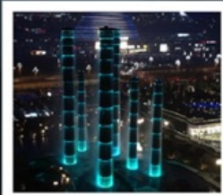
ห้างสรรพสินค้า SKP