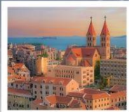
โบซาร์ต ST. EMIL