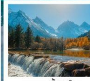
อุทยานปีผิงโกว