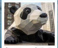
ห้าง IFS แพนด้าปิ่นตึก